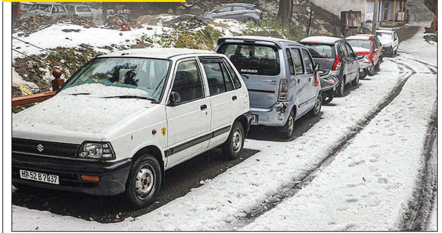
इन दिनों हिमाचल प्रदेश में ओलावृष्टि का दौर चल रहा है। गुरुवार को पहाड़ियों की रानी शिमला में भारी ओलावृष्टि के बाद सड़कें सफेद कंबल से ढक गईं। जिस कारण स्थानीय तापमान में गिरावट दर्ज की गई।