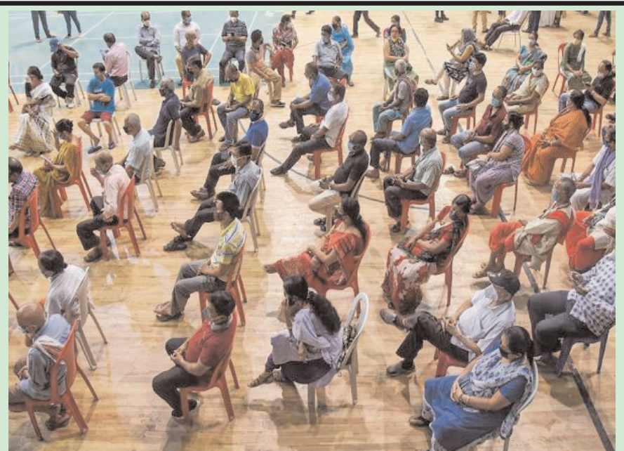
लाभार्थी कोरोनावायरस मामलों में कोविड-19 वैकसीन की खुराक प्राप्त करने के लिए गुवाहाटी में एक स्वास्थ्य केंद्र पर प्रतीक्षा करते हुए।