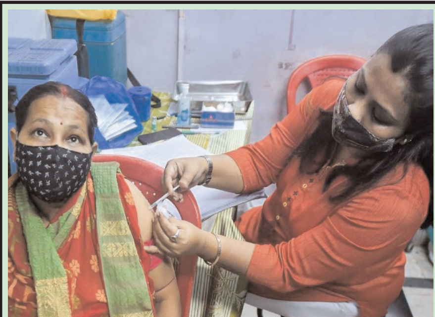
देश भर में बढ़ते कोरोनावायरस के मामलों के बीच कोलकाता के एक स्वास्थ्य केंद्र में एक लाभार्थी कोविड-19 वैकसीन की पहली खुराक प्राप्त करते हुए।