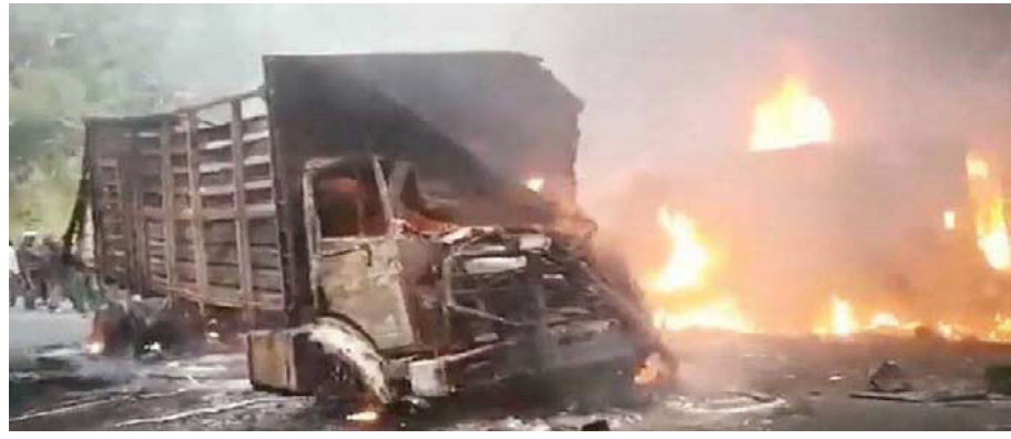
जानकारी के मुताबिक, 70 सीटों वाली ये बस पश्चिमी शहर फोउम्बान से राजधानी याउडे आ

53 यात्रियों की मौत, 21 लोग घायल देखते ही देखते मौके पर ही 53 यात्रियों की मौत हो गयी। वहीं 21 यात्री घायल बताये जा रहे, जिन्हें पश्चिमी शहर दाश्यांग और बफोउस्सम, अवा फोंका और अगस्टिन के अस्पतालों में भर्ती कराया गया है। मितली