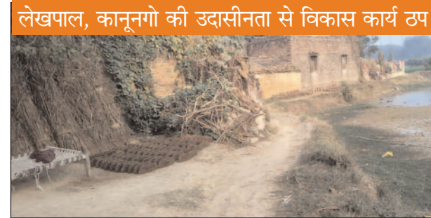
लेखपाल, कानूनगो की उदासीनता से विकास कार्य ठप