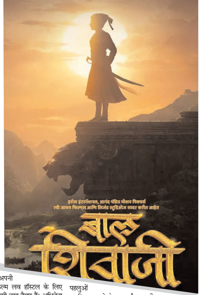
इरोज इंटरनेशनल, आनंद पंडित मोशन पिक्चर्स रवि जाधव फिल्मस आदि विभिन्न स्टूडियोज सहित करीब 100 प्रतिष्ठित व्यक्तित्व पर आधारित फिल्म बनाना सम्मान की बात है।