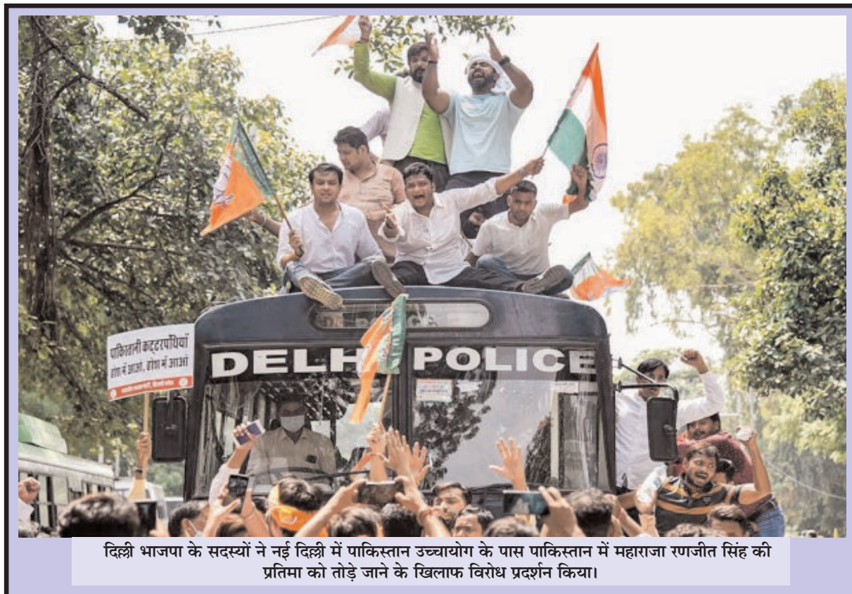
दिल्ली भाजपा के सदस्यों ने नई दिल्ली में पाकिस्तान उच्चायोग के पास पाकिस्तान में महाराजा रणजीत सिंह की प्रतिमा को तोड़े जाने के खिलाफ विरोध प्रदर्शन किया।