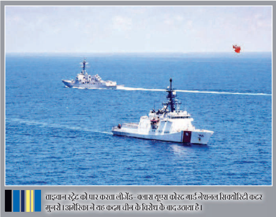
ताइवान स्टेट को पार करता लीजेंड- वलास यूएस कोस्ट गार्ड नेशनल सिवोरिटी कटर गुनरो।अमेरिका ने यह कदम तीन के विरोध के बाद उठाया है।

उन्होंने कहा कि इस महामारी की उत्पत्ति की अहम जानकारी चीन में है