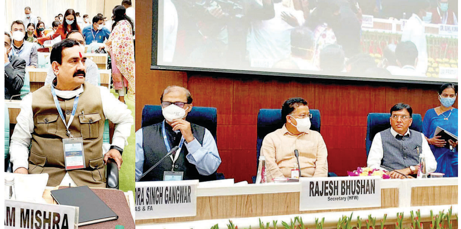
मध्यप्रदेश के गृह मंत्री डॉ. नरोत्तम मिश्रा, केंद्रीय स्वास्थ्य मंत्री मनसुख भंडारिया की अध्यक्षता में बुधवार को नई दिल्ली में आयोजित प्रधानमंत्री मंत्री आयुष्मान भारत स्वास्थ्य अवसरचना मिशन, कोविड इमरजेंसी रिसपन्स प्लेन और टीकाकरण बुद्धि के लिए आयोजित बैठक में शामिल हुए।