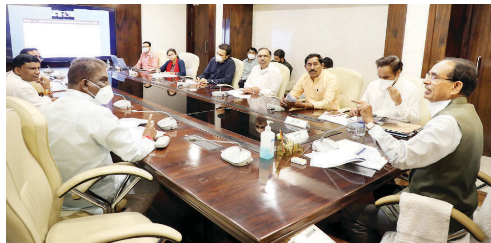
भोपाल में मुख्यमंत्री शिवराज सिंह चौहान ने आत्म-निर्भर मध्यप्रदेश के रोडमैप अंतर्गत लोक स्वास्थ्य समूह की विभागवार समीक्षा की।

मुख्यमंत्री श्री चौहान ने कहा कि स्वास्थ्य विभाग की प्रत्येक योजना आम आदमी के लाभार्थी चलाई जाती है। हमारा यह प्रयास होना चाहिए कि इन योजनाओं का लाभ प्रत्येक व्यक्ति को मिले। स्वास्थ्य योजनाओं का व्यापक चार-प्रसार किया जाए, जिससे आम नागरिक योजनाओं से अवगत होकर लाभ ले सके। बैठक में जानकारी दी गई कि आयुष्मान कार्ड बनवाने एवं नामांकन के लिए ऑन लाइन सुविधा उपलब्ध कराई जा रही है। प्रदेश में अभी तक कुल 2 करोड़ 53 लाख आयुष्मान कार्ड सत्यापित किए गए हैं।