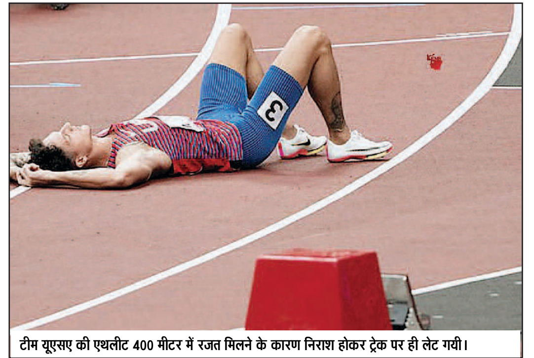
टीम यूएसए की एथलीट 400 मीटर में रजत मिलने के कारण निराश होकर ट्रैक पर ही लेट गयी।

तक पहुंचने की कोशिश कर रहे हैं। वे बार-बार गेंद को दूर से खेल रहे हैं। अपने बल्ले को गेंद की ओर दूर धकेल रहे हैं। इसी कारण गेंद बल्ले का किनारा लेकर विकेटकीपर या स्लिप में जा रही है। इसी कारण वह बड़ी पारी नहीं खेल पा रहे हैं। गावस्कर ने कहा, 'कोहली की खूबी गेंद को करीब से खेलना रही है। उन्होंने ज्यादातर रन इसी तरीके से बनाए हैं। अगर आप अपनी स्ट्राइक में खेलते हुए आउट हो जाते हैं तो भी कोई बुराई नहीं है।' कोई भी बल्लेबाज शॉट खेलता है और मिस भी करता है पर दूर की गेंद को छेड़कर आउट होना तो कमी मानी जाएगी और इसे दूर करना जरूरी है। उनके लिए यही बेहतर होगा कि वे दूर की गेंद को छोड़ दें।