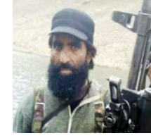
एनआईए ने किए चार आतंकी गिरफ्तार