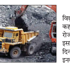
रोजाना हो रही आपूर्ति से चला रहे काम

रिजर्व कोयला नहीं बचा है। इनमें उत्तर प्रदेश और हरियाणा के 3-3 जबकि महाराष्ट्र और पश्चिम बंगाल के 2-2 संयंत्र शामिल हैं। राजस्थान, छत्तीसगढ़, मध्यप्रदेश, तमिलनाडु और झारखंड के 1-1 संयंत्र भी कोयले की इस कमी से जूझ रहे हैं।