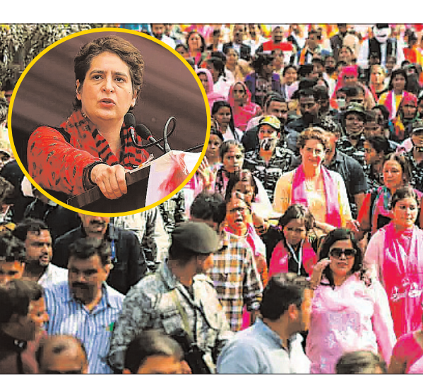
हूँ। पार्टी की तरफ से पंजीकरण को लेकर स्टाल तो लगाया गया था मगर उन महिलाओं के लिए कोई व्यवस्था नहीं थी जो लिख नहीं सकती थीं। मार्च में शामिल होने के लिए बड़ी तादाद में महिलाएं आई थीं। जिनको

एजेंसी लखनऊ। अंतरराष्ट्रीय महिला दिवस के अवसर पर मंगलवार को कांग्रेस की ओर से आयोजित महिला मार्च में हजारों की तादाद में महिलाएं और लड़कियां शामिल हुईं। गोमती नगर के 1090 चौराहा से शुरू हुए मार्च से पहले कांग्रेस महासचिव प्रियंका गांधी ने महिलाओं में जोश भरते हुए कहा लड़की हूँ लड़ सकती हूँ और कोई नहीं रोक सकता। उन्होंने कहा कि लड़की हूँ लड़ सकती हूँ का नारा सिर्फ चुनाव के लिए नहीं दिया गया है बल्कि यह एक आंदोलन है महिलाओं को उनका अधिकार दिलाने के लिए। पार्टी की ओर से विधानसभा चुनाव में जिन महिला उम्मीदवारों को प्रत्याशी बनाया गया था उनके साथ प्रियंका गांधी ने 1090 चौराहा से सिकंदर बाग चौराहा के लिए पैदल