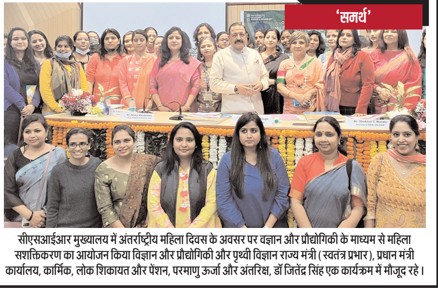
'समर्थ' सोएसआईआर मुख्यालय में अंतर्राष्ट्रीय महिला दिवस के अवसर पर वज्रान और प्रौद्योगिकी के माध्यम से महिला सशक्तिकरण का आयोजन किया विज्ञान और प्रौद्योगिकी और पृथ्वी विज्ञान राज्य मंत्री (स्वतंत्र प्रभार), प्रधान मंत्री कार्यालय, कार्मिक, लोक शिकायत और पेंशन, परमाणु ऊर्जा और अंतरिक्ष, डॉ जितेंद्र सिंह एक कार्यक्रम में मौजूद रहे ।

सोनभद्र : सपा ने पकड़ी स्ट्रांग रूम परिसर में जा रही मतपट्टी और मतपत्र लदी गाड़ी, जमकर हंगामा, अधिकारी पहुंचे