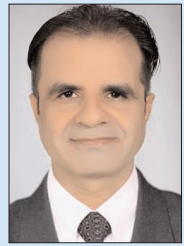
गोंदिया – वैश्विक स्तर पर हर वर्ष की तरह इस वर्ष भी 15 मार्च 2022 को विश्व उपभोक्ता अधिकार दिवस मनाया जाता है। इसे मनानेका उद्देश्य उपभोक्ताओं को जमाखोरी, मिलावट, नापतोले में गड़बड़ी, कालाबाजारी, मनमाने दाम वसूलना, बगैर मानक वस्तुओं की बिजली, ठगी, सामान की बिजली के बाद गारंटी न देने के प्रति लोगों को जागरूक करना है। अधिकतर देशों में इस दिवस के बारे में जागरूक करने के लिए हर वर्ष जगह-जगह पर कैम्प लगाये जाते हैं। लोगों को जागरूक करने के लिए हर वर्ष आयोजन किए जाते हैं।

गोंदिया – वैश्विक स्तर पर हर वर्ष की तरह इस वर्ष भी 15 मार्च 2022 को विश्व उपभोक्ता अधिकार दिवस मनाया जा रहा है और हर वर्ष की परिस्थितियों के अनुसार अलग-अलग थीम रखी जाती है जो इस वर्ष, न्याय संगत डिजिटल फाइनैस यह थीम रखी गई है। हर वर्ष 15 मार्च को अंतर्राष्ट्रीय स्तर पर विश्व उपभोक्ता अधिकार दिवस मनाया जाता है। इसे मनानेका उद्देश्य उपभोक्ताओं को जमाखोरी, मिलावट, नापतोले में गड़बड़ी, कालाबाजारी, मनमाने दाम वसूलना, बगैर मानक वस्तुओं की बिजली, ठगी, सामान की बिजली के बाद गारंटी न देने के प्रति लोगों को जागरूक करना है। अधिकतर देशों में इस दिवस के बारे में जागरूक करने के लिए हर वर्ष जगह-जगह पर कैम्प लगाये जाते हैं। लोगों को जागरूक करने के लिए हर वर्ष आयोजन किए जाते हैं।