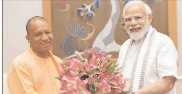
योगी ने पीएम का जताया आभार

मुलाकात के बाद पीएम मोदी ने ट्वीट किया, आज योगीजी से भेंट हुई। उन्हें उत्तर प्रदेश चुनाव में मिली ऐतिहासिक जीत की बधाई दी। बीते 5 वर्षों में उन्होंने जन-आकांक्षाओं को पूरा करने के लिए अथक परिश्रम किया है। मुझे पूर्ण विश्वास है कि आने वाले वर्षों में वे राज्य को विकास की ओर अधिक ऊंचाइयों पर ले जाएंगे। इस ट्वीट के बाद यह भी साफ हो गया है कि योगी ही यूपी के अगले सीएम होंगे।