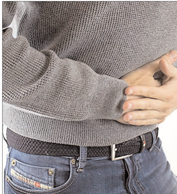
इसे ठीक करने में घरेलू उपाय बहुत ही काम आते हैं। तो चलिए आज इस लेख

चूंकि, पेट दर्द का प्रमुख कारण पाचन समस्याओं से संबंधित है और इसलिए