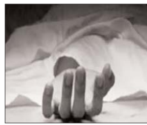
महाराष्ट्र के ठाणे जिले के रबोड़ी इलाके का है। परिवार के लोगों ने रबोड़ी थाने में आरोपी के खिलाफ शिकायत दर्ज कराई है। पुलिस के मुताबिक आरोपी की

सुंबई। महाराष्ट्र में एक शख्स ने देरी से नाश्ता मिलने पर अपनी बहू की गोली मारकर हत्या कर दी। गोली मारने के बाद से आरोपी ससुर फरार है और पुलिस उसे पकड़ने के लिए लगातार दबिश डाल रही है। बताया जा रहा है कि देरी से नाश्ता मिलने से नाराज ससुर ने अपनी लाइसेंस रिवांलवर से बहू के पेट में गोली मारी जिसके बाद परिवार वाले आनन-फानन में महिला को लेकर अस्पताल भागे जहां शुक्रवार को महिला ने दम तोड़ दिया। मामला