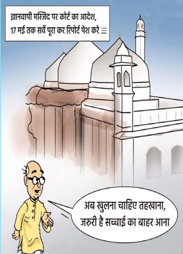
ज्ञानवापी मस्जिद पर कोर्ट का आदेश, 17 मई तक सर्वे पूरा कर रिपोर्ट पेश करे

अभी जम्मू-कश्मीर के मुस्लिम बहुल वाले कश्मीर में 46 सीटें हैं और बहुमत के लिए 44 सीटें ही चाहिए।