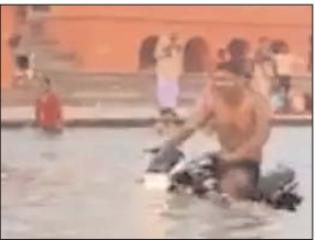
में लोगों की आवाजाही के बावजूद कुछ लोग कैसे मनमानी कर लेते हैं। युवक का सरयू नदी में बाइक चलाने वीडियो वायरल हो रहा है। नियमों की परवाह किए बिना राम की पैड़ी में प्रशासन की सख्ती को धज्जियां उड़ती साफ देखा जा सकती हैं। पावन सरयू नदी की जलधारा में एक युवक मोटरसाइकिल पर स्टंट कर रहा है। युवक की स्टंटबाजी का वीडियो

अयोध्या। रामनगरी अयोध्या में राम की पैड़ी पर स्नान करते हुए दंपति के रोमांस का वीडियो कुछ दिनों पहले जमकर वायरल हुआ था। यह मामला अभी शांत नहीं हुआ थी कि राम की पैड़ी का एक और वीडियो वायरल हो रहा है। इसके एक युवक सरयू नदी में बाइक से स्टंट कर रहा है। वीडियो में देख जा सकता है कि राम की पैड़ी में लोग स्नान कर रहे हैं और एक युवक नदी में बाइक चला रहा है वह भी सिर्फ अंडरवियर में है। युवक द्वारा नियमों की धज्जियां उड़ाते हुए साफ देखा जा सकता है। युवक के बाइक स्टंट का वीडियो वायरल होने से प्रशासन पर भी सवाल उठने लगे है। हर रोज इतनी बड़ी संख्या