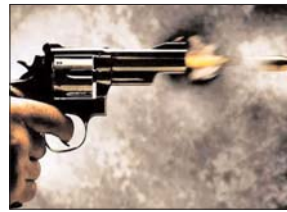
रहा था और फिर नीचे उतरा और खाना मांगने लगा। जैसे ही वो खाना निकालने के लिए उठी वैसे ही उसने कूकर को लात मार दी और फिर कमरे के अंदर गया और बंदूक उठाकर ले आया। इसके बाद उसने अपने बच्चों के सामने ही अपनी पत्नी को गोली मार दी।

हो रहे थे। दोनों जैसे ही सोन नदी पुल पर पहुंचे कि सामने एक ट्रक खड़ी दिखाई दी। ट्रक से पास लेने के लिए पीछे नजर घुमाई तो देखा कि एक कार तेजी से आ रही थी। कार से बचने के लिए ट्रक के पीछे ही बाइक को रोक दी लेकिन तब तक कार दोनों को सीधी टक्कर मारते हुए खड़ी ट्रक से टकरा गई। घटना के बाद कार चालक दुर्घटनास्थल से फरार हो गया। मौके पर पहुंची पुलिस ने मृतकों के परिजनों को सूचना दिया।