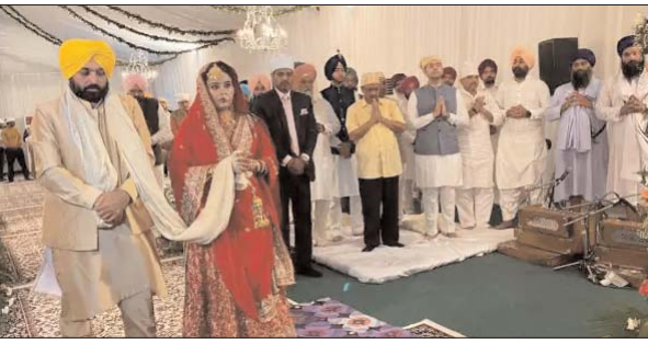
भाई की शादी के बाद छोटे की नंबर लगाना है।

आम आदमी पार्टी के सांसद राघव चड्ढा समारोह में पहुंचे थे। उन्होंने इस सुंदर जोड़े की तस्वीरें भी साझा कीं। इस मौके पर राघव चड्ढा ने हंसी-टिटोली भी की। उन्होंने पंजाबी में कहा, साहे बीर दा व्याह, सानू गोड़े गोड़े चाहे यानी मेरे बड़े भाई की शादी है और आज मैं बहुत खुश हूँ। अब बड़े