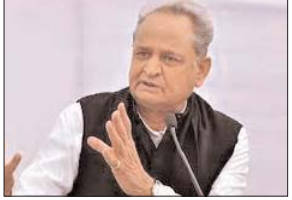
अगर सब मिलकर कोई काम करेंगे तो काम समयबद्ध पूरा होगा, एक दिन की देरी भी क्यों हो, सिंचाई की सुविधा है। पीने के पानी की सुविधाएं हैं, हम चाहेंगे कि समय पर ये योजना पूरी हो। उन्होंने कहा कि क्यों नहीं केन्द्र सरकार आगे आकर ये घोषणा करती है कि प्रधानमंत्री ने जो वादा किया है वो