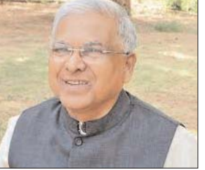
पॉजिटिव प्रकरणों में सभी परिजन की जांच हो। यही दृष्टिकोण गर्भवती माताओं की जांच में भी रखना चाहिए। उन्होंने क्षय रोग उपचार प्रबंधन में पोषण, नियमित औषधि सेवन संबंधी व्यवस्थाओं के दृष्टिगत संस्थागत उपचार व्यवस्थाओं को विस्तारित कर क्षय रोग उपचार प्रयासों संबंधी पहल करने के लिए कहा।

भोपाल। मध्यप्रदेश के राज्यपाल मंगुभाई पटेल ने स्वास्थ्य विभाग के अधिकारियों के साथ सिकल सेल एनीमिया और टी.बी. रोग उपचार प्रबंधन कार्यों की समीक्षा की। उन्होंने टोकन-टू-टोटल की कार्य-नीति के साथ रोग उपचार प्रबंधन करने को कहा। रोग स्क्रीनिंग कार्य के लिए क्षेत्र विन्हित कर सघन जांच का कार्य किया जाना चाहिए। श्री पटेल ने कहा कि रोग स्क्रीनिंग कार्य की दिशा रोग के लक्षित समूह के निर्धारण और सघन जांच पर केन्द्रित होनी चाहिए। सिकलसेल स्क्रीनिंग के लिए ऑनगाड़ी केंद्रों, प्राथमिक, माध्यमिक और हायर सेकेण्डरी स्कूलों में जांच केम्प लगाकर चिन्हंकन किया जाए।