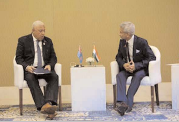
क्रियान्वयन का हवाला देते हुए सभी बकाया मोर्चों से सेनाओं को पूर्ण वापसी की जरूरत पर बल दिया ताकि सीमावर्ती क्षेत्रों में शांति एवं स्थिरता कायम हो सके। डॉ. जयशंकर ने एलएसी पर लंबित मुद्दों का त्वरित समाधान का आह्वान किया। उन्होंने कुछ इलाकों में सेनाओं से आमने सामने से हटाने के निर्णय के

इस संबंध में दोनों मंत्रियों ने कहा कि दोनों पक्षों के सैन्य एवं कूटनीतिक अधिकारियों को नियमित संपर्क में रहना चाहिए। उन्होंने अगले दौर की सीनियर कमांडर स्तर की बैठक किसी नजदीकी तिथि को बुलाने की अपेक्षा व्यक्त की। विदेश मंत्री ने कहा कि भारत एवं चीन के संबंध तीन