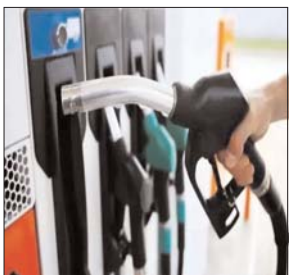
इंडियन ऑयल कॉर्पोरेशन लिमिटेड ने भी अप्रैल-जून में 1,992.53 करोड़ रुपए का नेट लॉस दर्ज किया था, जबकि एक साल पहले इसी अवधि में नेट प्रॉफिट 5,941.37 करोड़ रुपए और जनवरी-मार्च तिमाही में 7,021.9 करोड़ रुपए था।

नई दिल्ली। आने वाले दिनों में पेट्रोल-डीजल की कीमतों में इजाफा हो सकता है। इसकी वजह है देश की सरकारी तेल कंपनियों को हो रहा घाटा। हिंदुस्तान पेट्रोलियम कॉर्पोरेशन लिमिटेड को वित्त वर्ष 2022-2023 की पहली तिमाही (अप्रैल-जून) में 10,196.94 करोड़ का नुकसान हुआ है। ये किसी भी तिमाही में कंपनी को हुआ सबसे ज्यादा घाटा है। पिछले वित्त वर्ष की समान तिमाही में कंपनी को 1,795 करोड़ रुपए का मुनाफा हुआ था। वहीं जनवरी-मार्च तिमाही में यह आंकड़ा 1,900.80 करोड़ रुपए पहुंच गया था। इससे पहले 6,021.9 करोड़ रुपए था।