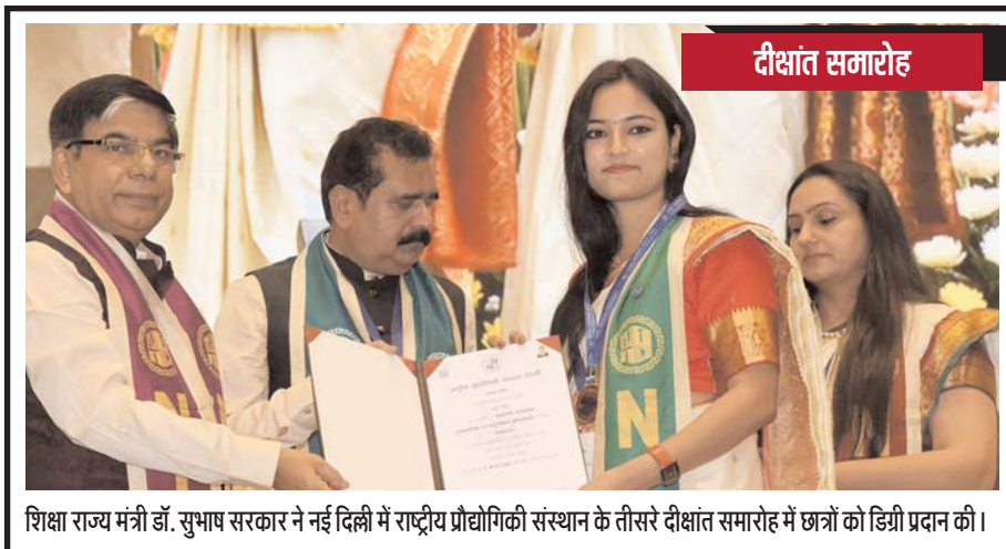
शिक्षा राज्य मंत्री डॉ. सुभाष सरकार ने नई दिल्ली में राष्ट्रीय प्रौद्योगिकी संस्थान के तीसरे दीक्षांत समारोह में छात्रों को डिग्री प्रदान की।

UPA की उम्मीदवार मार्गरेट अल्वा को कांग्रेस, DMK, RJD, NCP और समाजवादी पार्टी के वोट मिले। इन पार्टियों के वोटों की संख्या 139 थी। इनके अलावा झारखंड मुक्ति मोर्चा, TRS और आम आदमी पार्टी ने भी अल्वा को वोट देने का फैसला किया था। इन तीनों के 29 सांसद हैं। शिवसेना के उद्धव गुट के 9 सांसद अल्वा के साथ थे।