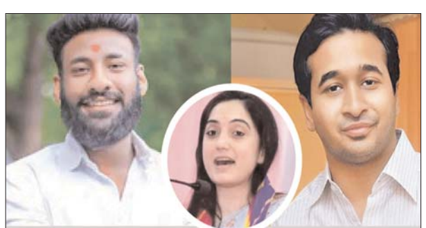
तरह के हमले जारी रहे तो हमारे हाथ बंधे नहीं हैं। महाराष्ट्र शरिया कानून से नहीं, बल्कि संविधान से चलेगा। व्या है पूरा मामला? अहमदनगर के कर्जत इलाके में

मुंबई। महाराष्ट्र के अहमदनगर जिले में नूपुर शर्मा का समर्थन करने पर एक युवक पर करीब 15 लोगों ने तलवार और हॉकी स्टिक से हमला कर दिया। युवक गंभीर रूप से घायल हो गया, जिसका निजी अस्पताल में इलाज चल रहा है। घटना जिले के कर्जत इलाके में 4 अगस्त को हुई। अहमदनगर थाने में केस दर्ज कर लिया गया है। पुलिस ने इस मामले में अभी तक 4 लोगों को गिरफ्तार किया है। हालांकि मुख्य आरोपी अभी भी फरार है। उसकी तलाश की जा रही है। इस बीच भाजपा विधायक नितेश राणे ने कहा कि अगर हिंदुओं पर इस