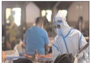
आंकड़ों के मुताबिक बीते 24 घंटों में कोरोना संक्रमण के 19,406 नए मामले सामने आने से सक्रियों की कुल संख्या बढ़कर 4,41,26,994 हो गयी। जबकि इसके संक्रमण से 19,928 लोगों के स्वस्थ होने के साथ ही कोरोनामुक्त होने वालों की कुल संख्या बढ़कर 4,34,65,552 हो गयी है। देश में सक्रिय मामलों की दर 0.31 प्रतिशत है, जबकि रिकवरी दर 98.50 और मृत्यु दर 1.19 फीसदी पर बरकरार है।

नयी दिल्ली। देश में पिछले 24 घंटे में कोरोना संक्रमण के 19,406 नए मामले सामने आए हैं और 19,928 मरीजों के स्वस्थ होने से इस महामारी से निजात पाने वालों की कुल संख्या 4346552 हो गयी है। देश में सक्रिय मामले 571 कम होने से इनकी कुल संख्या घटकर 1,34,793 रह गयी है। इस महामारी से पिछले 24 घंटों में 38 लोगों की जान जाने से मृतकों का आंकड़ा बढ़कर 5,26,649 हो गया है। इस बीच देश में आज सुबह सात बजे तक 205.92 करोड़ से अधिक टीके लगाये जा चुके हैं। पिछले 24 घंटों में 32,73,551 लोगों का टीकाकरण किया गया।