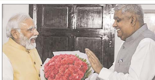
कोशिश में प्रत्यक्ष या अप्रत्यक्ष तौर पर भाजपा का समर्थन किया। उन्होंने अपनी विश्वसनीयता को नुकसान पहुंचाया है।