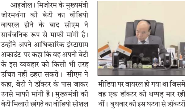
मौडिया पर वायरल हो गया था जिसमें वह एक डॉक्टर को थप्पड़ मार रही थीं। बुधवार की इस घटना से डॉक्टरों में रोष है।