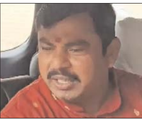
तैनाती भी की गई थी। बता दें कि भाजपा से निलंबित विधायक टी. राजा सिंह ने आज सुबह

एक बार फिर से विरोध प्रदर्शन तेज हो गए थे। बुधवार रात को भी हजारों की भीड़ हैदराबाद की सड़कों पर उतरी थी और सिर तन से जुदा के नारे लगाते हुए टी. राजा सिंह के खिलाफ ऐक्शन की मांग की थी। हैदराबाद के कई इलाकों में बीते कुछ दिनों से लगातार विरोध प्रदर्शन जारी हैं। पुलिस ने बुधवार को लाठीचार्ज भी किया था ताकि भीड़ को तितर-बितर किया जा सके। इसके अलावा आरएफ की