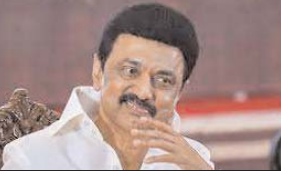
मॉडल को अपनाकर तमिलनाडु राज्य द्वारा पिछले पचास वर्षों में अर्जित की गयी उपलब्धियों को लागू किया जा सका।

एजेंसी चेन्नई। तमिलनाडु के मुख्यमंत्री एम के स्टालिन ने रविवार को कहा कि देशभर के अन्य राज्य शासन के द्रविड़ मॉडल को अपनाने के लिए उत्सुकता दिखा रहे हैं। सामाजिक न्याय पर तीसरी अंतराष्ट्रीय मानवता बैठक को वर्युअली संबोधित करते हुए श्री स्टालिन ने कहा कि अन्य राज्यों की सतारूढ सरकारों भी शासन के द्रविड मॉडल को समझना और अपने अपने राज्य में लागू करना चाहती हैं। इस दौरान वे मानवता का आधार सामाजिक न्याय को बताते हुए उन्होंने कहा कि सामाजिक न्याय की संकल्पना मानवता के आधार पर बनी थी और