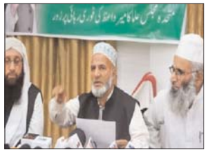
यह फैसला हुआ कि इस तरह की गतिविधियों पर जल्द से जल्द रोक लगनी चाहिए।

'संतों की घाटी की मुस्लिम पहचान हो रही कमजोर' संगठन ने कहा कि बैटक के दौरान सर्वसम्मति से एक प्रस्ताव पारित किया गया और संतों की घाटी की मुस्लिम पहचान को कमजोर करने पर गंभीर चिंता व्यक्त की गई। मीटिंग के दौरान एक वीडियो सोशल मीडिया पर वायरल हुआ था, जिसमें एक सरकारी स्कूल के छात्रों को रघुपति राघव राजा राम गते हुए देखा गया था। एमएमएयू ने अधिभावकों से अनुरोध किया कि अगर उनके बच्चों को सरकारी स्कूलों में गैर-इस्लामिक गतिविधियों में भाग लेने के लिए विवश किया जाता है तो उन्हें अपने बच्चों को इन स्कूलों से निकालकर उनका निजी स्कूलों में दाखिला करवाना चाहिए।