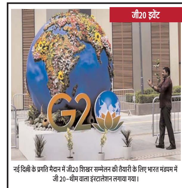
नई दिल्ली के प्रगति मैदान में जी20 शिखर सम्मेलन की तैयारी के लिए भारत मंडपम में जी20-शीम वाला इंस्टालेशन लगाया गया।

जा रहा है। उन्होंने बताया कि यह प्रदर्शन 13 जिलों को सभी जगहों में हो रहा है। किसान-मजदूर इकट्ठा होकर अपने-अपने जगहों में केंद्र सरकार का पुतला फूंक कर प्रदर्शन कर रहे हैं। बता दें कि किसानों के यह वही संगठन हैं जिन्होंने पिछले दिनों 21 अगस्त को चंडीगढ़ के लिए कूच भी किया था। पुलिस ने किसानों को रोकने के लिए जहाँ कई जगह लाठीचार्ज किया था। वहीं पर कई किसानों को घरों में ही नजरबंद कर दिया था कई किसान गिरफ्तार कर जेल में बंद कर दिए थे।